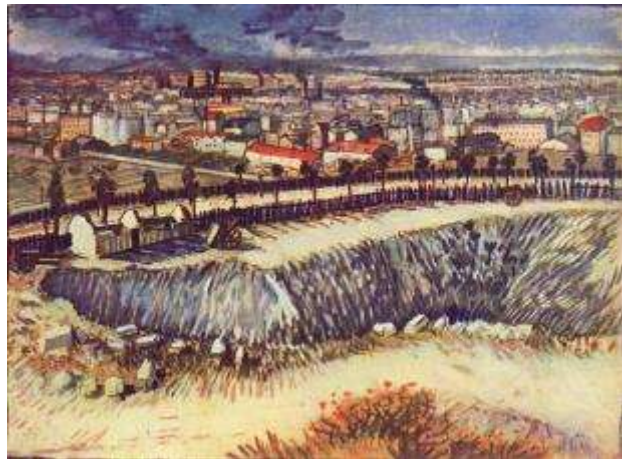
Il mondo reale