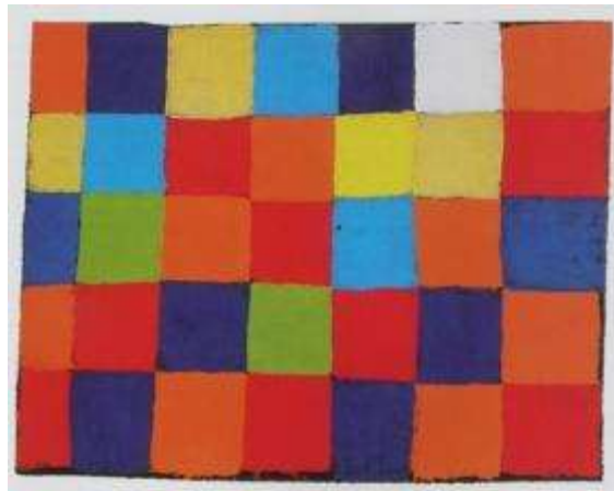
Il sistema di indicatori