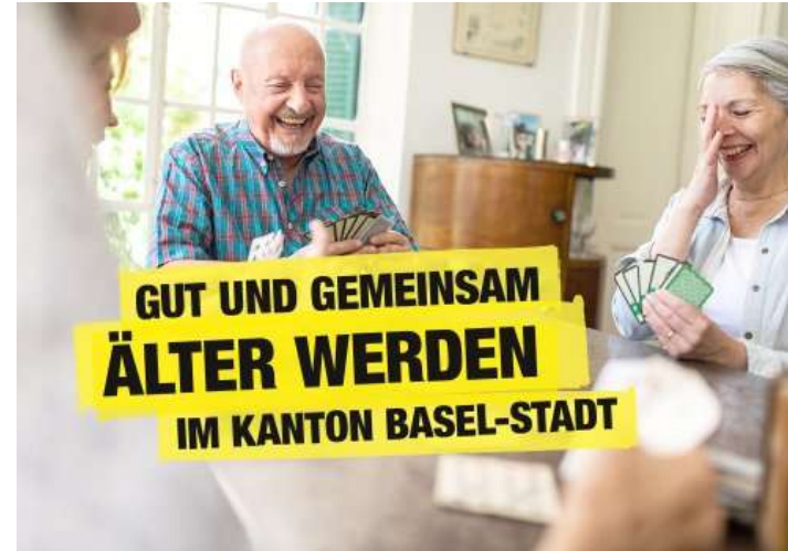
Dipartimento della sanità di Basilea-Città