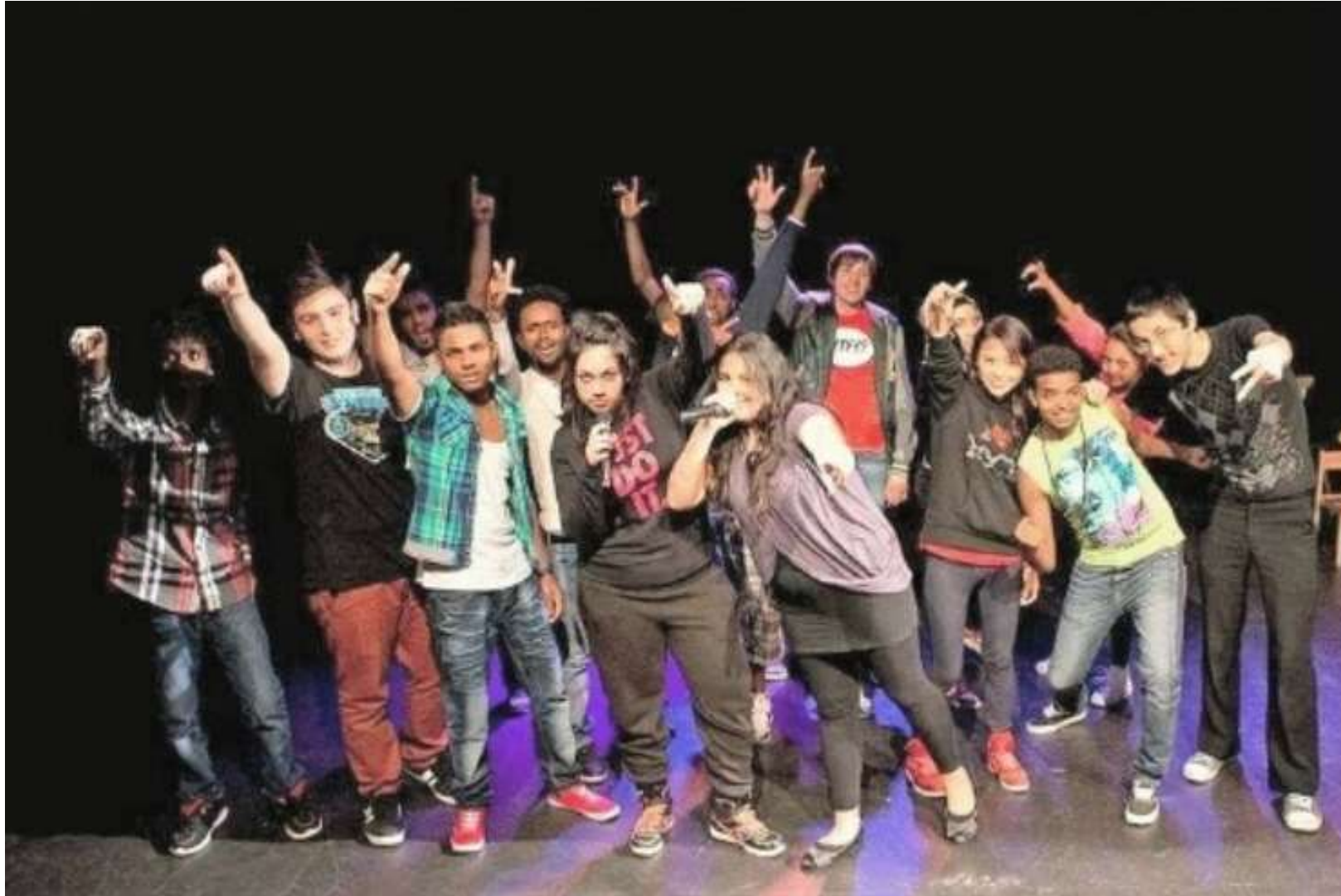
Prove teatrali di una classe nell'ambito del progetto «fremd?!»