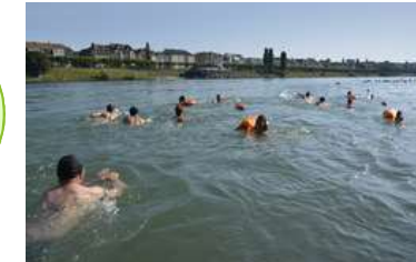
Fotografia: Juri Weiss